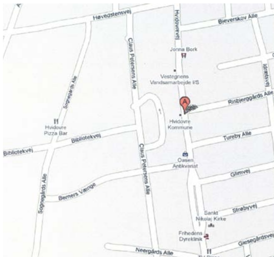
Hvidovre Medborgerhus, Hvidovrevej 280, 2650 Hvidovre