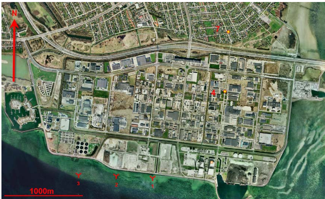
Figur 1 Kort med den omtrentlige placering af de planlagte vindmøller samt målepunkter.