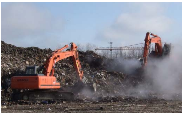
Figur 4 Den målte kompaktor (øverst) og de målte gravemaskiner hos AV-Miljø.

Der er i beregningerne forudsat, at én kompaktor og to gravemaskiner arbejder samtidigt i det område, der er vist i Figur 5 med en rød prik. Ydermere er det forudsat, at vindhastigheden er 8 m/s, at der er medvind fra maskinerne i alle retninger, og at terrænet på alle transmissionsveje består af 75 % hårdt terræn og 25 % porøst terræn. Beregningerne er foretaget efter Nord2000-metoden.