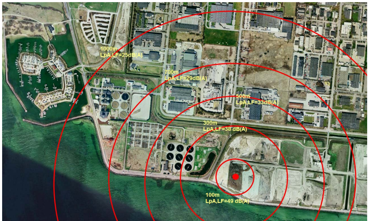
Figur 5 Resultater af beregninger af det lavfrekvente udendørs støjbidrag L_{pA,LF} fra én kompaktor og to gravemaskiner, der arbejder samtidigt i området ved den røde prik.